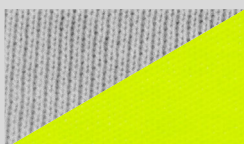
Face coton côté peau